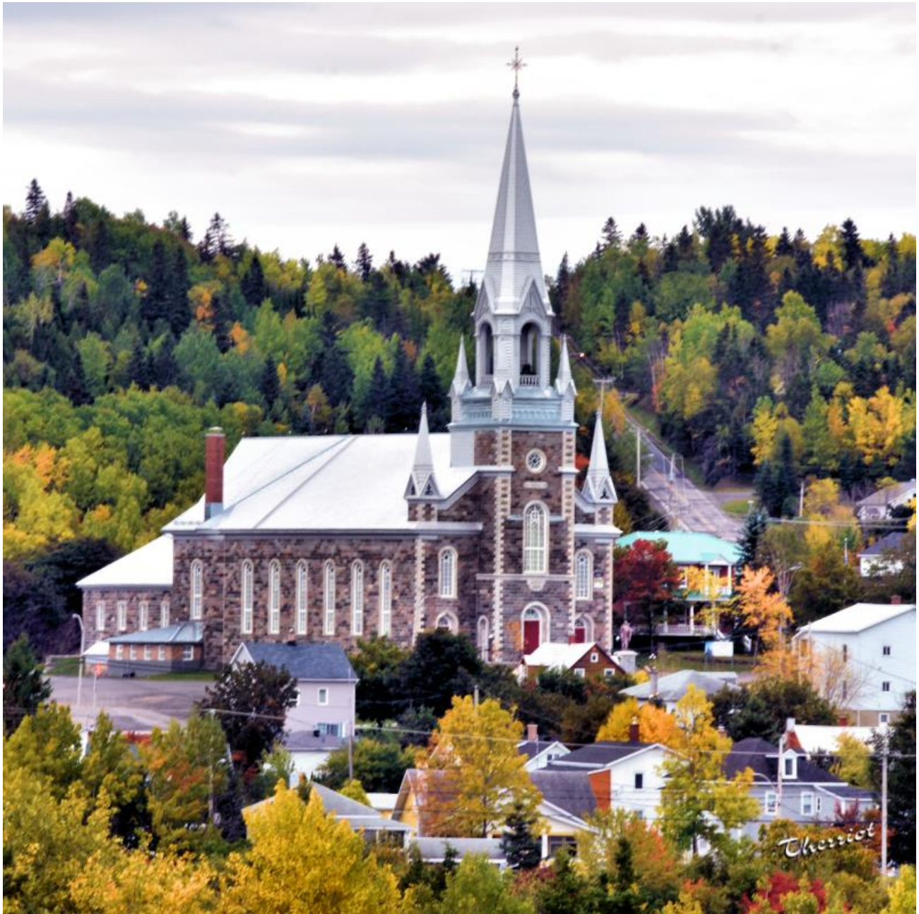
Église construite en 1892