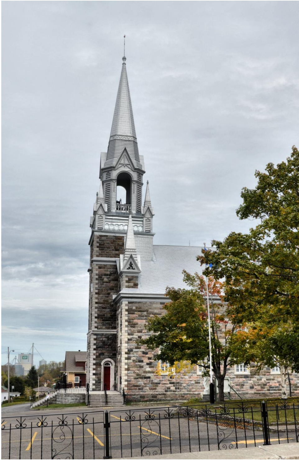
Église construite en 1892